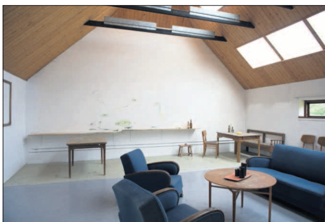
Atelieret står stort set, som Asger Jorn forlod det. Fotografier fortæller, at det også var her, der blev debatteret og festet.