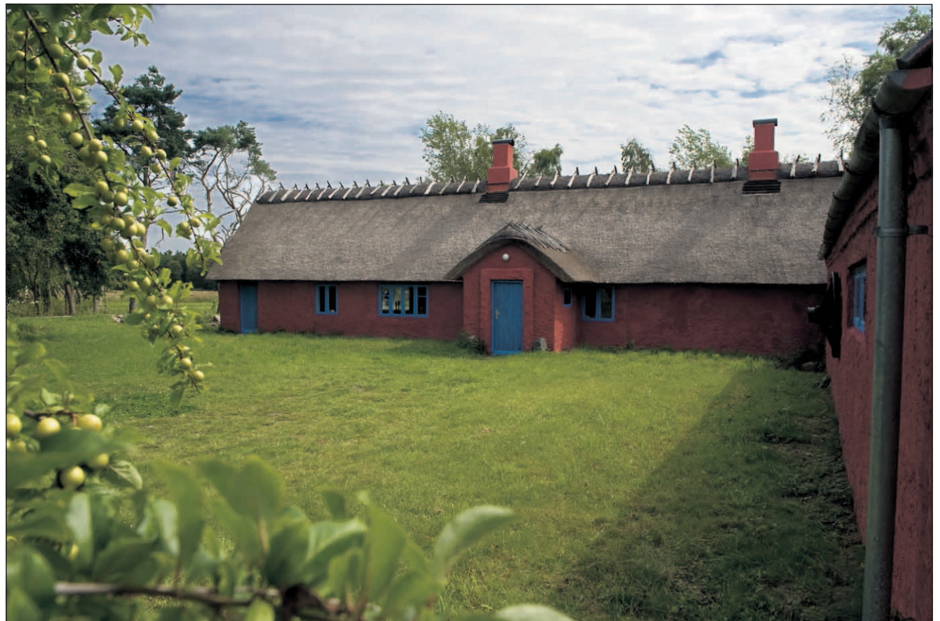
Huset ligger i udkanten af de 25 tønder land natur, der hører med til stedet.

»Stedet skal bruges og slides og ikke behandles som et museum eller en helligdom. Det ville være imod Jorns ånd. Der skal skabes og være plads til ro og fordybelse. Man skal drikke, spise, el-